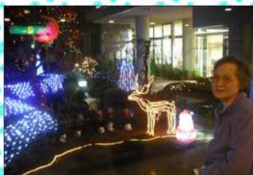
クリスマスイルミネーション