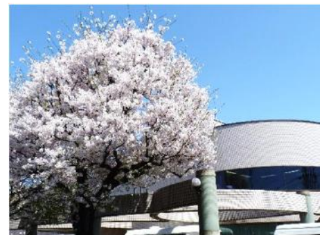
けやき苑の今春の桜です